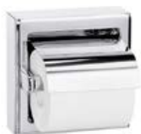
IMAGEN DE PRODUCTO Y PLANO