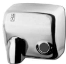
IMAGEN DE PRODUCTO Y PLANO