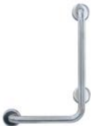
IMAGEN DE PRODUCTO Y PLANO