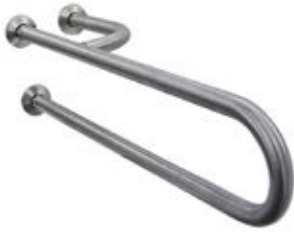
IMAGEN DE PRODUCTO Y PLANO